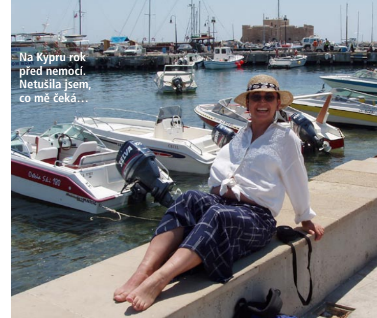
Na Kypru rok před nemocí. Netušila jsem, co mě čeká...