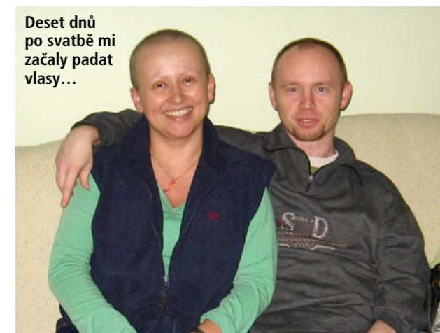
Deset dnů po svatbě mi začaly padat vlasy...