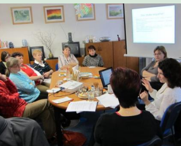
V rámci odpoledních programů v MH centrech jsou zařazovány i odborné přednášky na různá témata