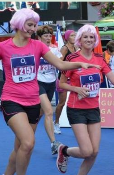
I letos nás čekají velké akce, jako jsou běhy v rámci závodů seriálu Prague International Marathon nebo Pochod pro Mamma HELP