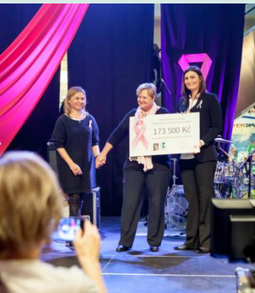
Slavnostní předávání šeků v OC Letňany