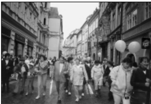
Pochod proti rakovině

našeho snažení – přinést zdravé ženské populaci vhodnou formou co nejvíce informací o možnostech prevence nádorového onemocnění prsu.