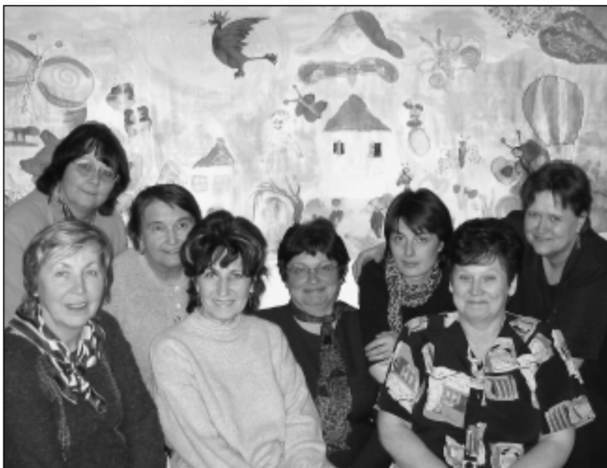
Laické terapeutky MAMMA HELP CENTRA