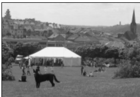
Happening na Parukářce

Stáli jsme také u zrodu tradice pražského Happeningu pro rodiny s dětmi, který jsme spolu s dalšími pražskými sdruženími a firmou AVON Cosmetics připravili na Parukářce v Praze 3 u příležitosti Dne dětí. Slogan „Nejlepší dárek pro dítě je zdravá máma!“ vystihuje smysl