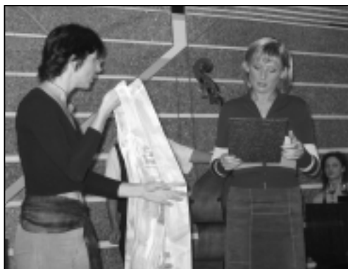
Večer v Atriu 02

Také v roce 2002 proběhl úspěšně Společenský večer v Atriu. Koná se již tradičně pod patronací MČ Praha 3. Kromě věnovaných uměleckých děl zaujala diváky i přehlídka kolekce dámského prádla firmy ÚPAVAN. Výtěžek z prodeje darovaných artefaktů byl použit na provoz MAMMA HELP CENTRA.