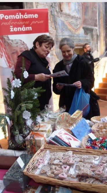
Mikulášský bazar pořádaný Nadací Víze 97 manželů Havlových