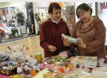
Adventní benefiční prodej ve Velkém Špalíčku v Brně