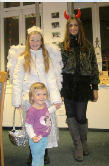
Anděl s čertem přišli i do MH centra v Olomouci

Kromě provozování našich poraden v sedmi městech se samozřejmě zabýváme řadou dalších projektů, užitečných pacientkám i veřejnosti. A v roce 2013, stejně jako skoro v každém roce předchozím, přijdeme určitě i s něčím novým. Vynuceně (změnou legislativy) s pozměněným názvem a právním statutem, naše historie nám naštěstí prý zůstane. A zcela dobrovolně a rádi nabídneme nějaké naše nové nápady, které, doufám, přinesou smysluplný užitek. První z nich už můžu prozradit: na spadnutí je totiž otevření našeho MAMMA SHOPU! V internetovém obchodě si budete moci vybrat z opravdu širokého sortimentu našich rukodělných výrobků, které dnes máme díky šikovným rukám mammahelpek „na skladě“, a já se moc těším, že vám udělají radost. A doufám, že nám přivydělají třeba na rekondiční pobyty.